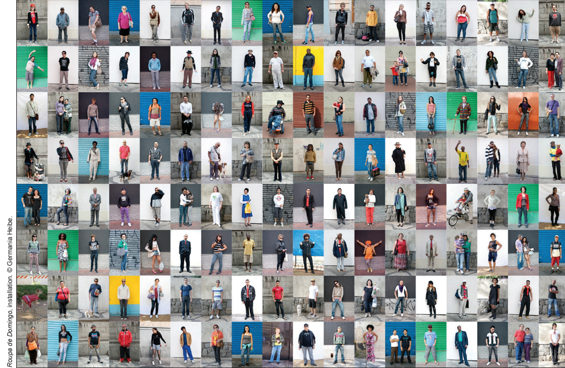
Roupa de Domingo, installation. © Germania Heibe.